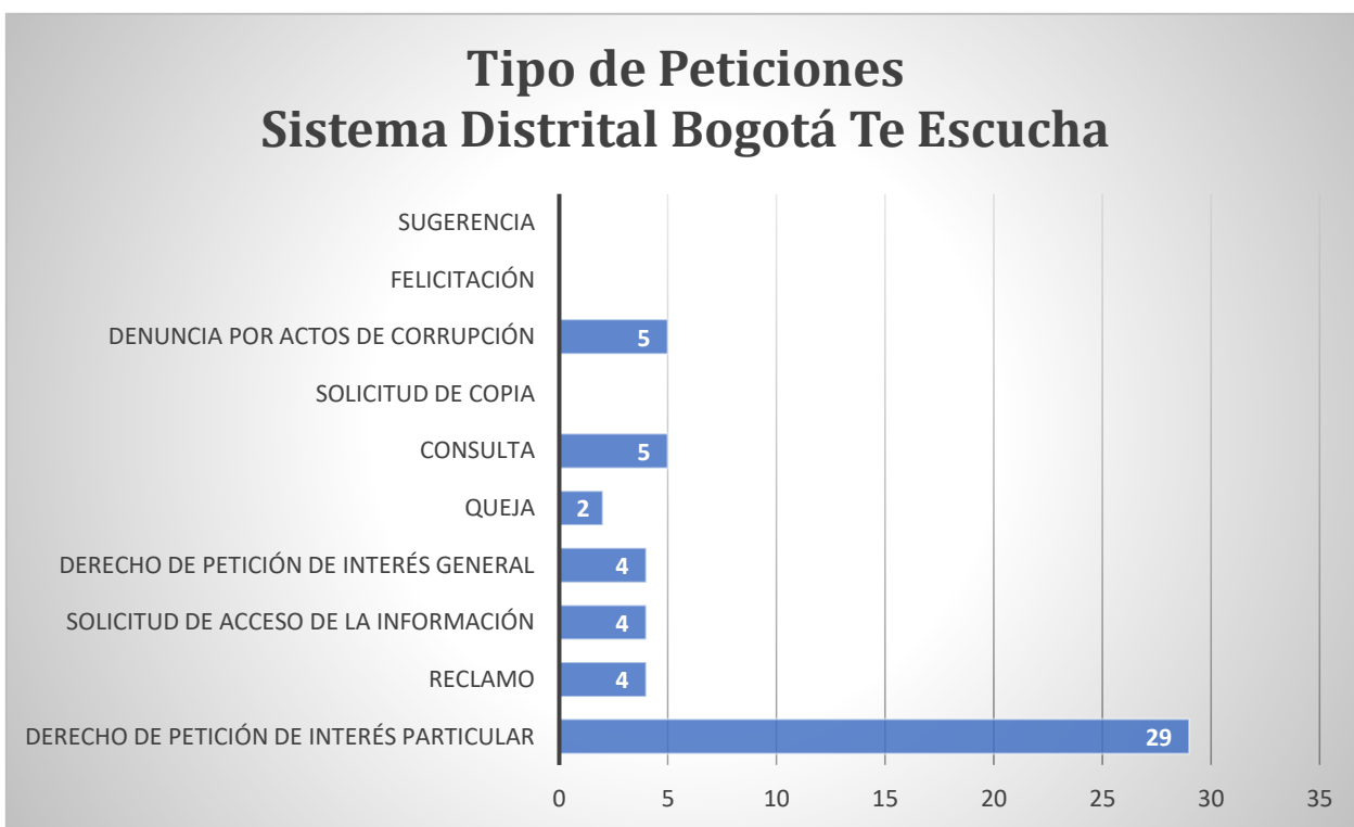
Gráfica 2. Tipo de peticiones sistema distrital Bogotá Te Escucha. Fuente: Elaboración propia Unidad de Quejas, Reclamos y Atención al Ciudadano